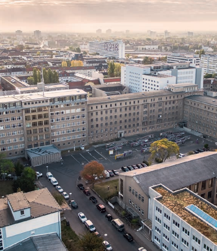
↑ Das einst abgeriegelte Gelände bietet heute zahlreiche Besucherangebote.